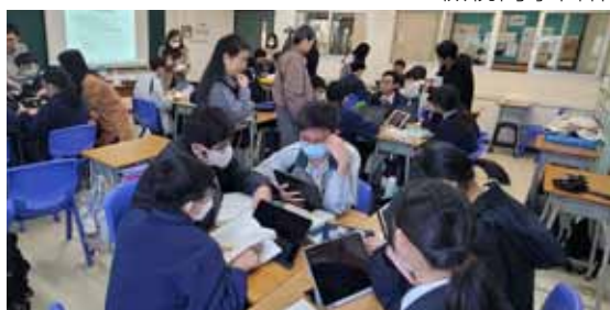
教師觀課了解學生共學過程

至同意。可見同學對於是次自主學習分組活動普遍表示有興趣及歡迎此類的學習活動。有言自主學習是一個學與教的範式轉移，可見對於求知慾強的同儕而言，也勇於接受新的學習模式。