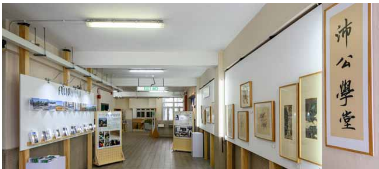
呂中藝術節 2 樓展覽