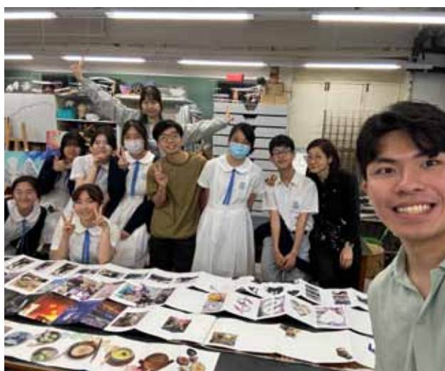
中四視藝科同學與藝術家黃百亨

整個計劃裡，同學可以一口氣經歷作為藝術家的一個創作體驗：由構思意念、資料搜集、賞析、創作、裝裱、展示、分享交流作品等，由專業的藝術工作者陪同一起經歷。另外亦讓其他學校的師生認識我們的呂中視藝生的創意，有機會與大家分享自己的創作歷程，實在是一寶貴經驗。希望這個計劃可以成為本科的核心課程，每年都能邀請不同媒介的專業藝術家與學生分享創作經驗，讓同學更早認知創作的大環境，裝備好自己。