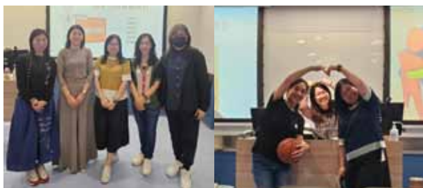
欣賞各小組匯報成員的認真及努力

小記：是次進修的意外收穫是認識一班教育同工，他們都是認真教學，為學校、學生盡心盡力，當然更要多謝各位導師，從他們身上學到很多，真是獲益良多！