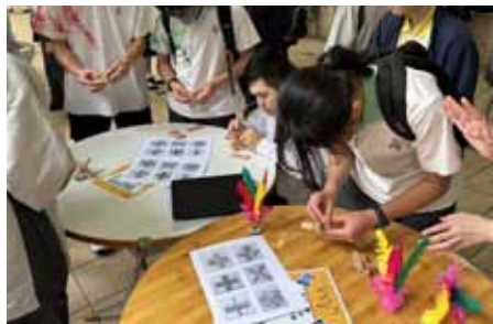
國民教育周 傳統民間遊戲體驗