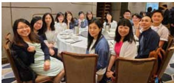
與老師同學暢聚，交流各校心得