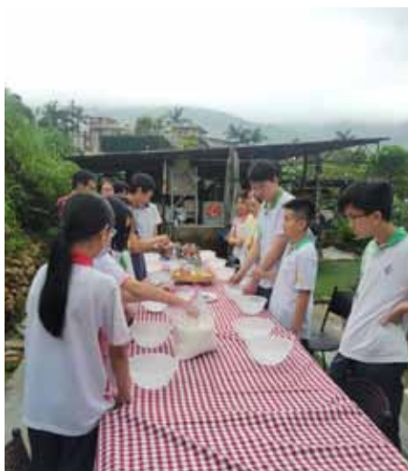
Students cooking at an organic farm in Tai Po

To manage all aspects of our health, it is very important that the right lifestyle choices become an integral part of our daily lives. It is therefore critically important that we expand our learning about health literacy also outside of classrooms. Several Home Economics-related activities were held this year where the focus was not only on nutrition but also on emotional well-being and healthy relationships with the community. A true highlight of these activities was a HE ECA co-organized visit to an organic farm in Lam Tsuen, Tai Po, where students could pick seasonal organic vegetables and cook them.