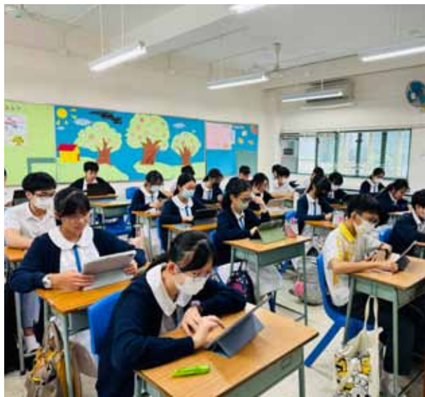
同學嘗試使用錄像平台

其次，在老師製訂不同版本的學案時，會仔細考慮教學目的，並思考如何為達到該目的而設計課堂活動，達至減負增效。例如剛開始設計課程時，誤以為只要有學生滙報部分，「說話技巧」便是教學目的。然而，經提醒後才明白，並非每項在課堂上發生的事也需視為教學目的，釐清教學目的才能聚焦教學重點，製訂活動內容，去蕪存菁。