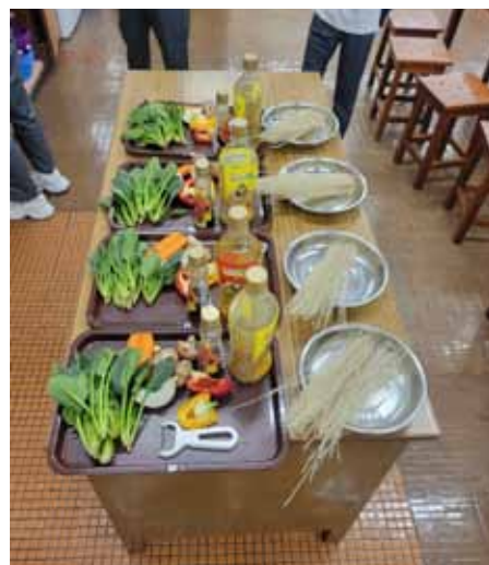
Fresh ingredients for Korean Japchae ready for the Form 3 cooking class.

nutrients, often containing too much added sugar, salt and fat, as well as various additives and preservatives, and interfering with our metabolism. Shockingly, up to 70% of calories from a teenager's diet in the USA might come from UPFs and even though the exact figures from Hong Kong are currently not available, the teenagers in Hong Kong are most likely heading in the same direction. That is why there is a very strong emphasis on using primary fresh unprocessed ingredients in all the Home Economics lessons, so that students can learn how to correctly prepare them and safely cook them. Where possible, we also use fresh herbs, spices and less common healthy ingredients so that students can learn about them through hands-on experience.