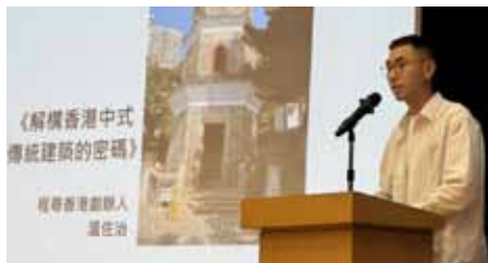
國民教育周 中五周會 香港中式傳統建築