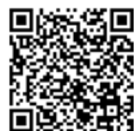
Student work and assessment criteria