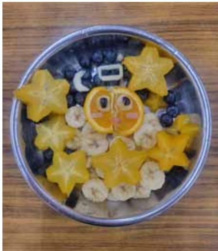
Form 2 students' creation - decoration from fruits.

students have made. For Form 1 students it is often challenging to handle the ingredients correctly (washing, peeling, chopping), and progress in this area can be seen through the school term. Form 2 students are indeed more skillful but can often struggle with the execution details (timing, team work or cooking techniques), and again much progress is seen throughout the school year. The newly introduced Form 3 lessons enabled the students to hone their skills and consolidate their theoretical as well as practical understanding.