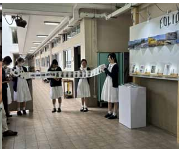
中四同學介紹自己的攝影書作品