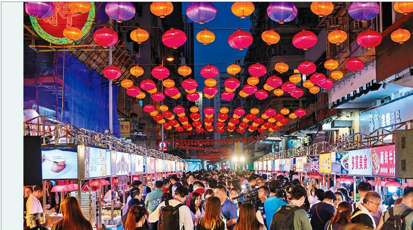
廟街夜市開鑼，現場氣氛熱鬧，人頭湧湧。